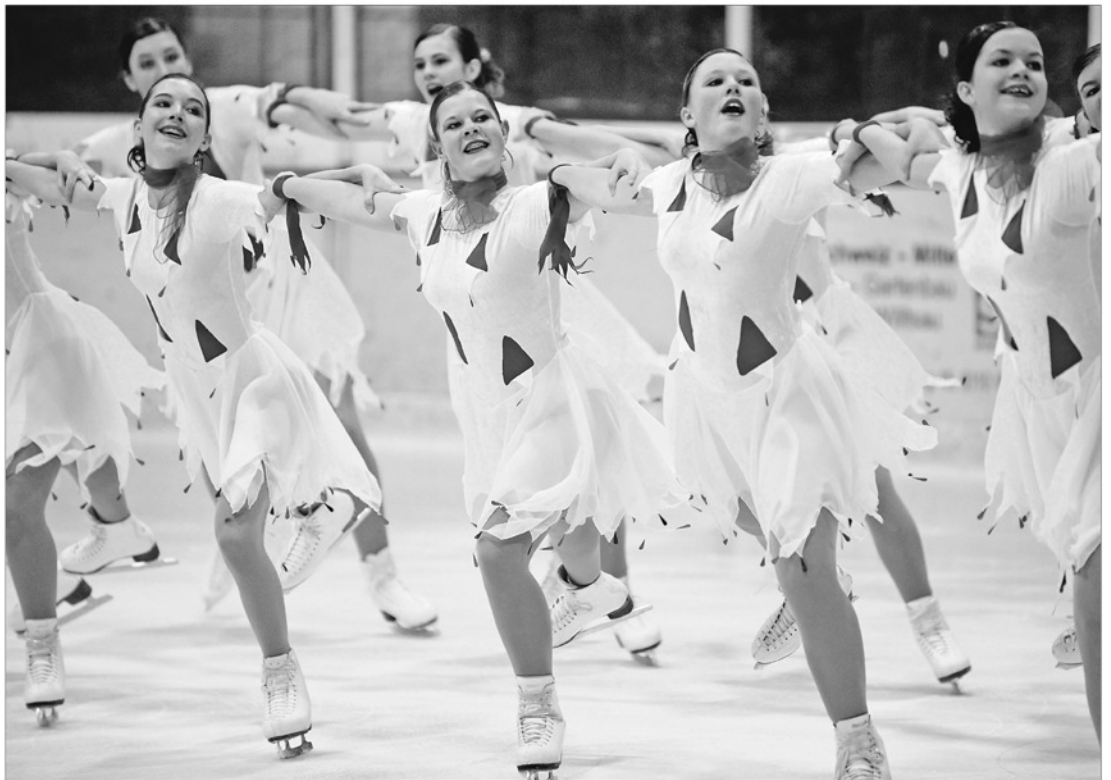
Die Huttwiler Eislaufequipe «Snowflakes» holte sich am EVBN-Cup nach hartem Training den Sieg vor Heimpublikum.

Am gleichzeitig stattfindenden Teameislauf-Cup des Eislaufverbandes Bern-Nordwestschweiz EVBN machten 18 Teams mit, welche die Sportart Synchronized Skating als Breitensport ausüben. Bei etlichen Equipen stand die Freude am gemeinsamen Auftritt vor grosser und lautstarker Kulisse im Zentrum. Und trotzdem packte alle Beteiligten der Ehrgeiz, es möglichst erfolgreich zu machen. Besonders eindrücklich gelang dies dem heimischen Team «Snowflakes». In der Junioren-Kategorie konnte die Formation des Skating Clubs Huttwil, zur grossen Freude des mitklatschenden Publikums, den dritten Sieg in Serie feiern. «Wir haben viele Zusatztrainings eingeschaltet, um uns optimal auf diesen Wettkampf vorzubereiten», berichtet Trainerin Monika Schneider. Obwohl das 16-köpfige Huttwiler Team die klar beste Darbietung zeigte, wurde es am Ende eng. «Wir mussten als erstes Team unser Programm zeigen, was immer ein Nachteil ist», erklärt Schneider. In der Tat liess das Preisgericht bei der Bewertung noch Platz nach oben frei. «Ein weiterer Grund für das diesjährige Zusammenrücken der Junioren-Teams ist die Einführung des Breitensportreglements», begründet Monika Schneider.